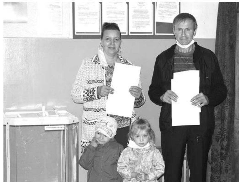
Семейный выход. На избирательном участке в д.Дубровка.

ли губернатора и депутатов - Законодательного Собрания, районных Собраний, городских и сельских